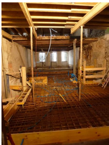
Reconstruction des dalles en béton