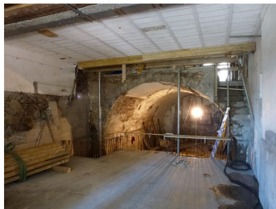
Sciage de la voute au sous-sol