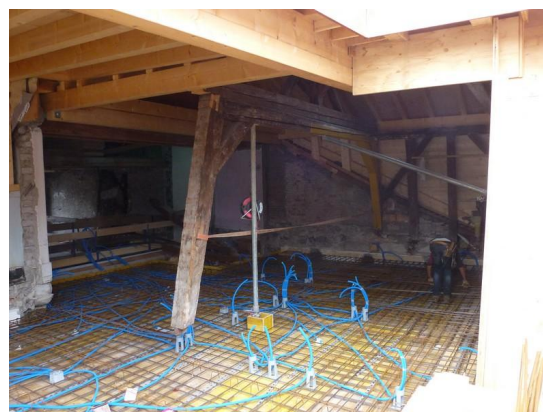
Remplacement de la charpente