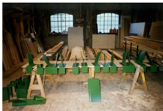
Préparation des poutres en atelier